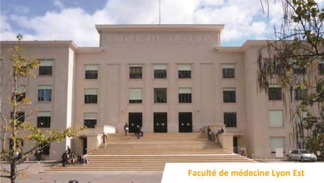
Faculté de médecine Lyon Est