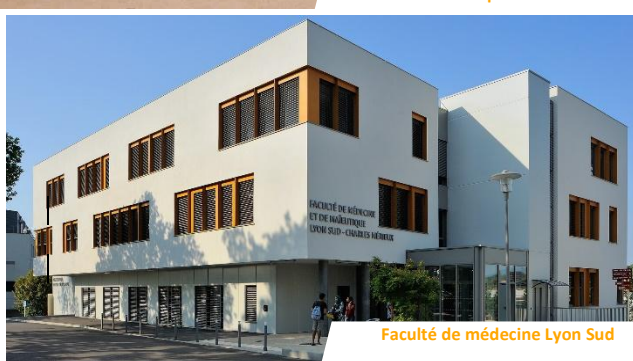
Faculté de médecine Lyon Sud