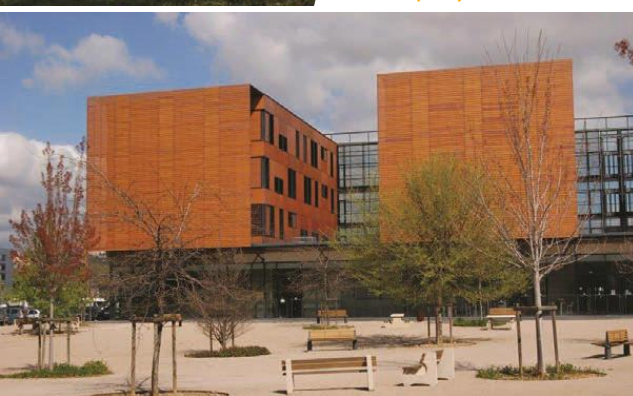
ISFA – Campus Gerland