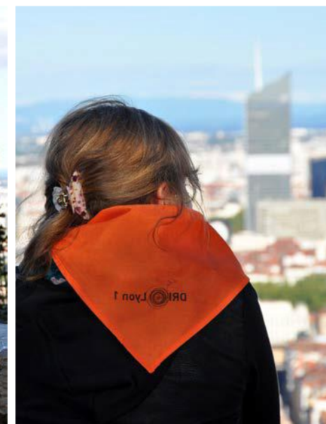
Étudiants